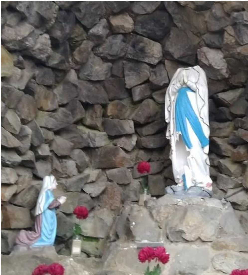
Pôvodné sadrové sochy, stav 18.12.2020 – po poškodení sochy Panny Márie neznámym vandalom.