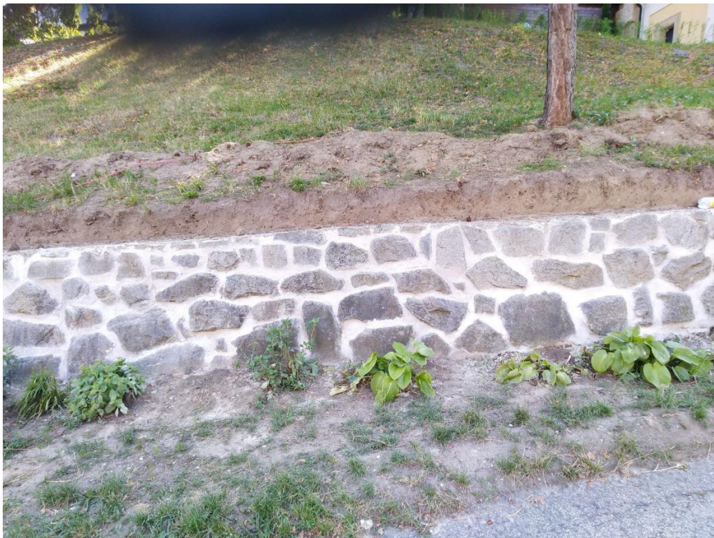
Ľavý oporný múr areálu Kaplnky a Jaskyne po obnove tvaru a spárovania.