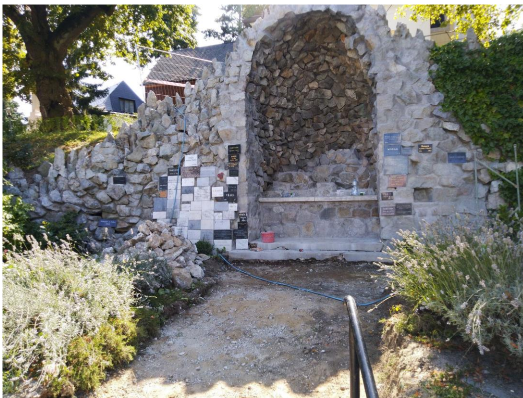
Nástupný priestor jaskyne po odstránení betónovej plošiny (bude nahradená dlažbou) a po vyčistení a zaspárovaní priečelia jaskyne.