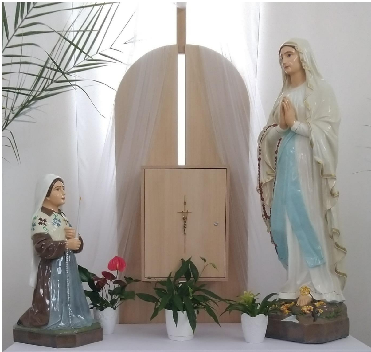
Nové sochy Panny Márie a sv. Bernadety z materiálu umelá živica. Sú vystavené na bočnom oltári v kostole Ducha Svätého.