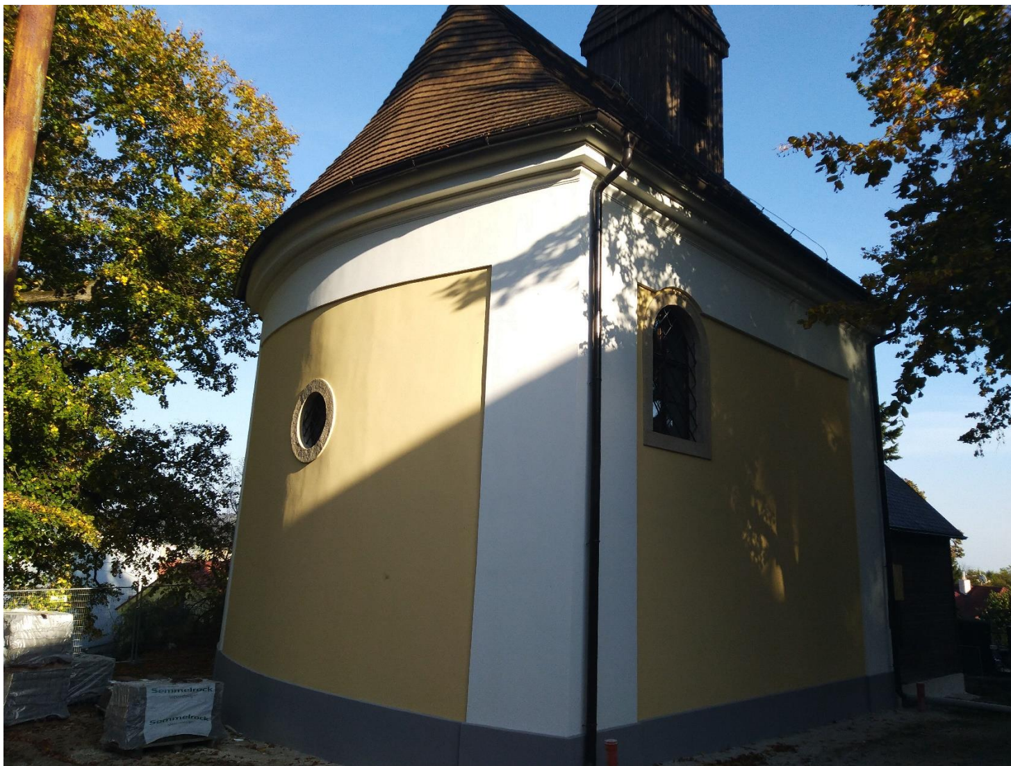
Nový farebný šat fasád kaplnky