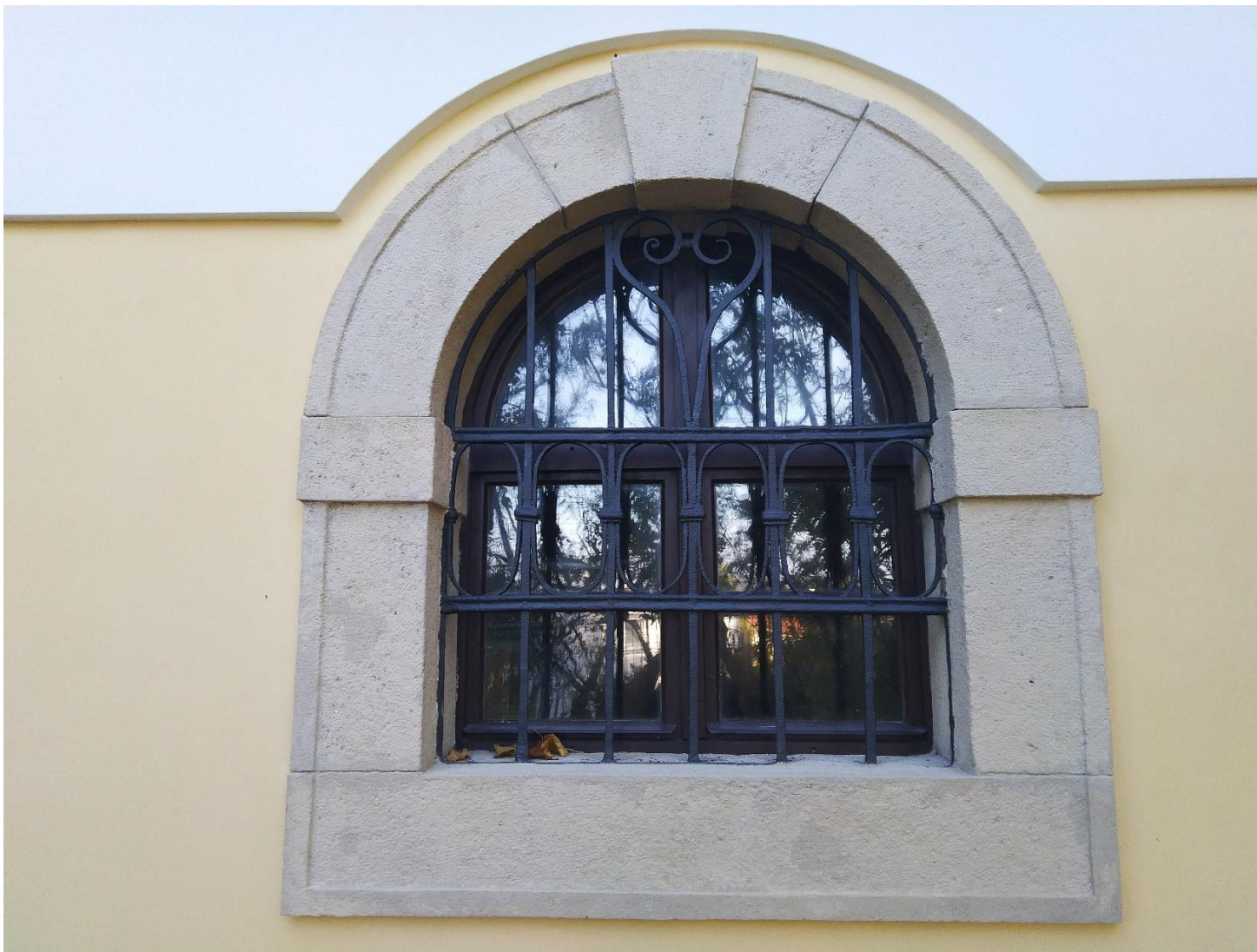
Obnovené kamenné ostenia, mreže a okná.