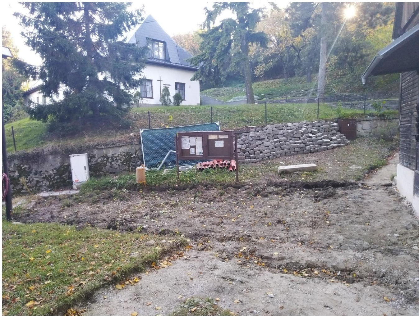
Nádvorie Kaplnky bez rozobranej pôvodnej dlažby