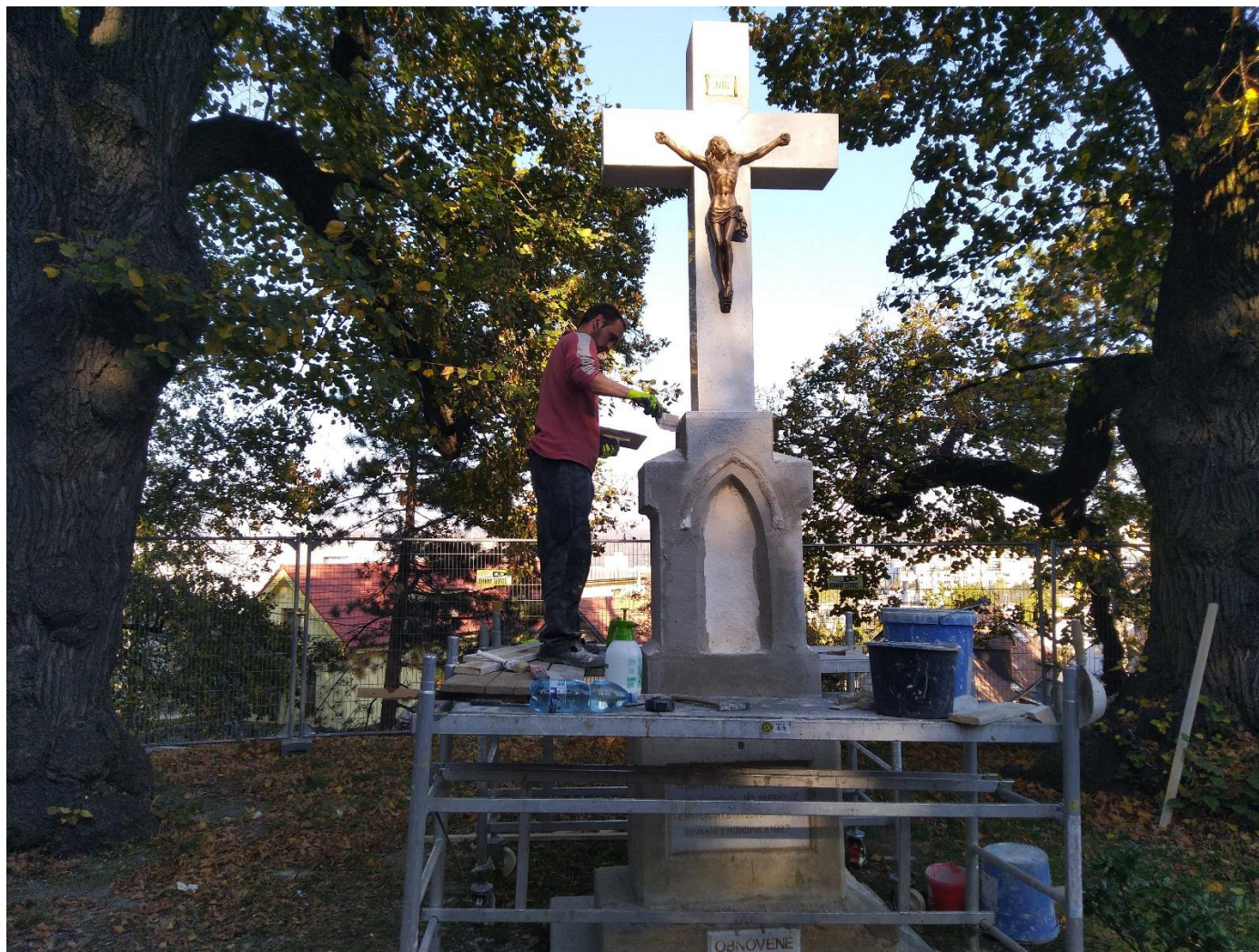
Reprofilácia tvarov pôvodného kríža pred kaplnkou