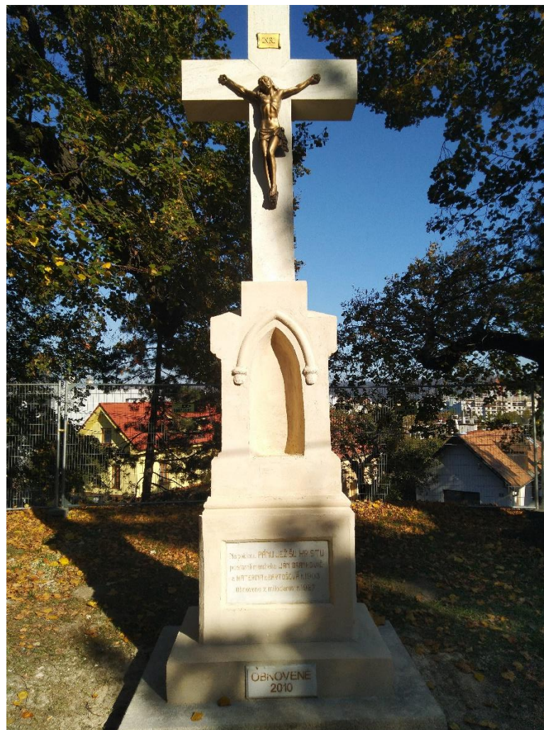
Kríž pred finalizáciou štruktúry povrchu a náterom