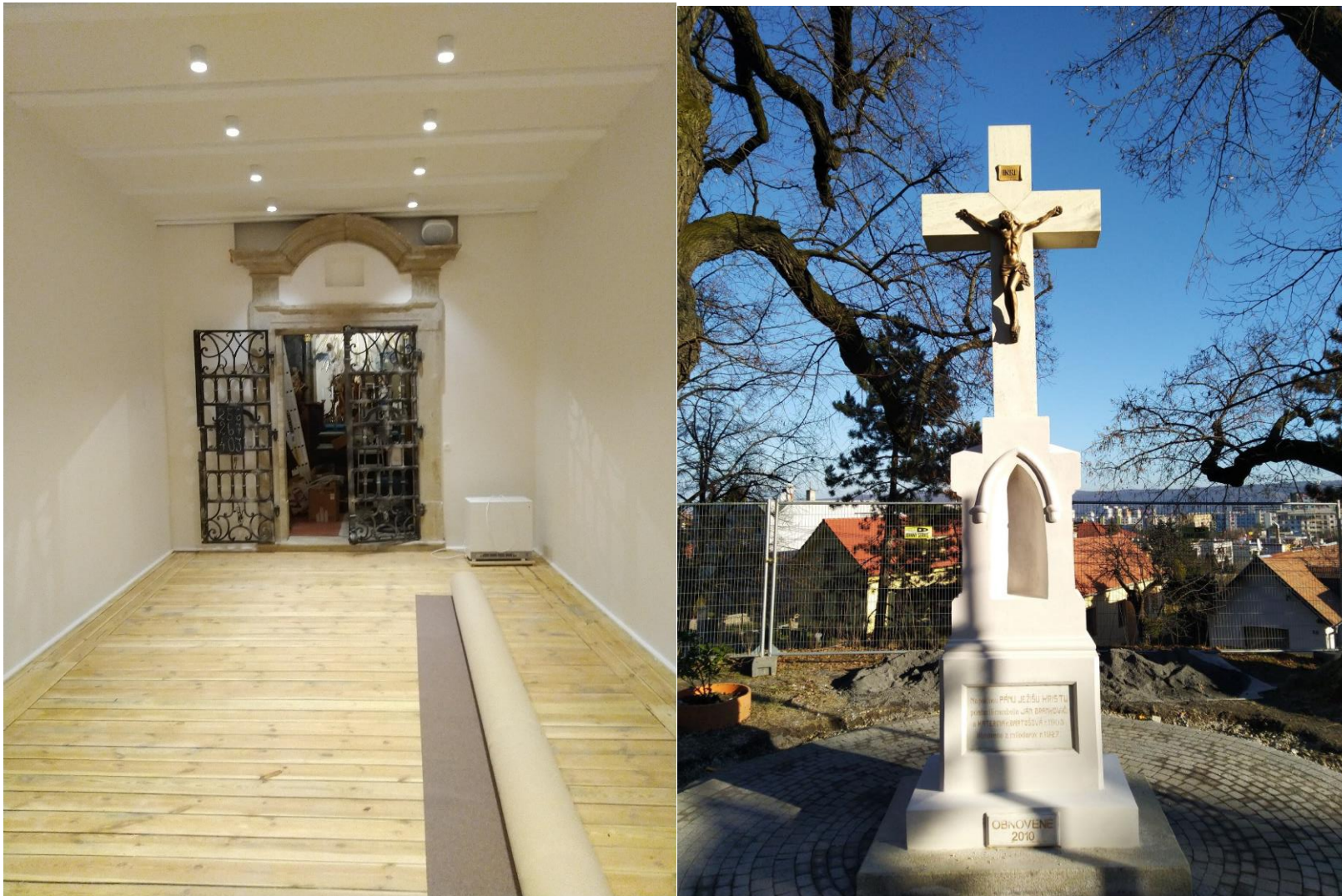
Prístavba po maľovke, vybrúsení podlahy – pred kladením nového koberca. Nanovo zreštaurovaný kríž pri kaplnke.