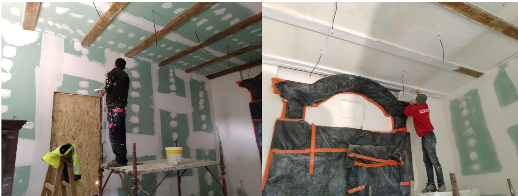
Finalizácia sadrokartónového obkladu interiéru kaplnky, maľba stien.